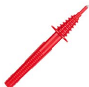
Sonda ostrzowa czerwona 5 kV (gniazdo bananowe)